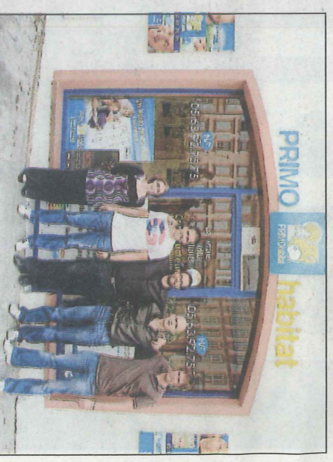
Tous ensemble !

bouche à oreille de personnes satisfaites. Notre société se porte bien et nous permet d'envisager l'avenir sereinement, nous continuons à faire de notre mieux pour proposer des maisons qui «tiennent la route», puisque jusqu'ici notre travail a porté ses fruits. Pour conclure, Primo Habitat c'est aussi un esprit d'équipe qui s'est forgé sur des valeurs communes, telles que le respect, l'honnêteté, le dynamisme et enfin le sérieux «.