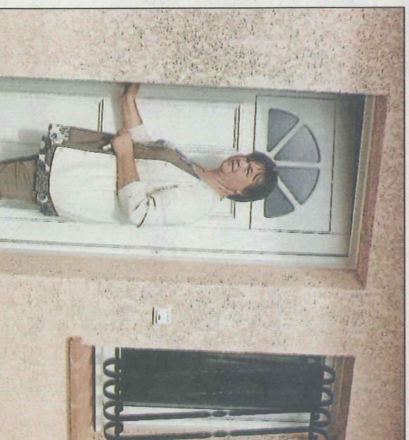
La visite peut commencer.